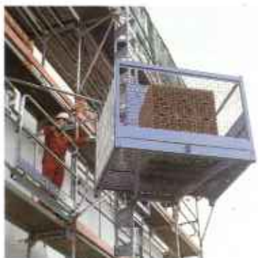
Zahnstangenauflüge mit Stahlmast