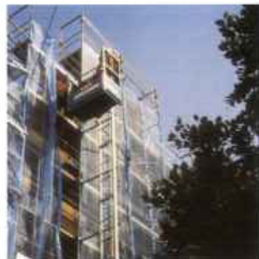
Schräg- und Senkrechtaufzug mit Zahnstange