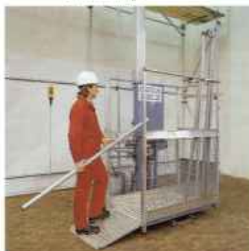
Zahnstangenauflüge mit Aluminiummast