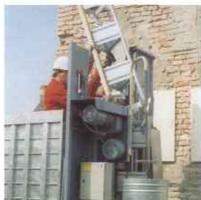
Die Montage der Mastteile und Mastverankerungen erfolgt von der Bühne aus. Ohne Kranhilfe können die handlichen 1,5 m hohen Stahlmaste mit unverlierbaren Schrauben und gesicherten Muttern schnell aufgesetzt werden.