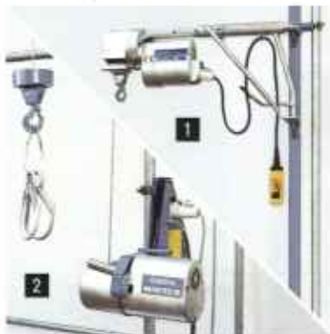
Seilaufzüge: ■ Schwenkarmzüge ■ Gerüstaufzüge