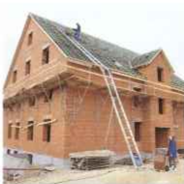
Schrägaufzüge mit Seil