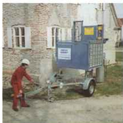
Für den Straßentransport steht ein Anhänger zur Verfügung. Das Auf-/Abladen erfolgt mittels des Transportbühnen-Antriebes.