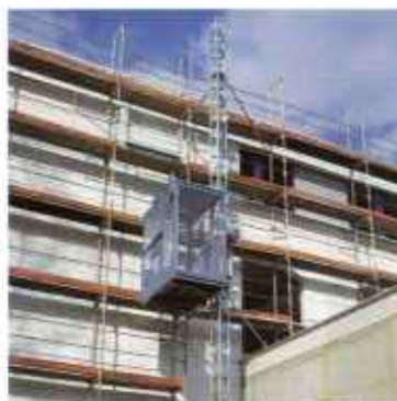
Personen- und Lasteraufzüge