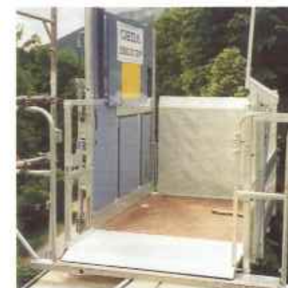
Zur Absturzicherung werden an den Be- und Entladestellen feuerverzinkte Etageeinrichtungen (1 Stück im Lieferumfang enthalten) mit mechanisch verriegelter Schiebetür montiert.