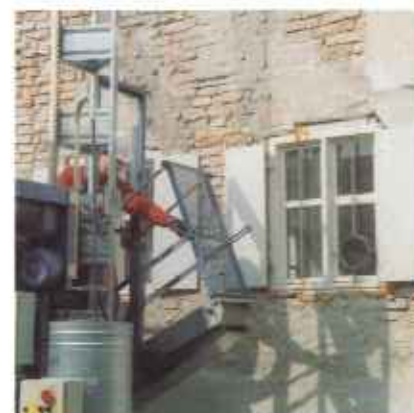
Mit dem Montageschritt (nachrüstbar) kann die Transportbühne auch ohne vorgebautem Gerüst verankert werden.